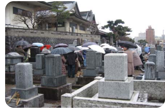
雨の中、鶴彬の墓前に献花し参加者三十人全員で合掌を行いました。