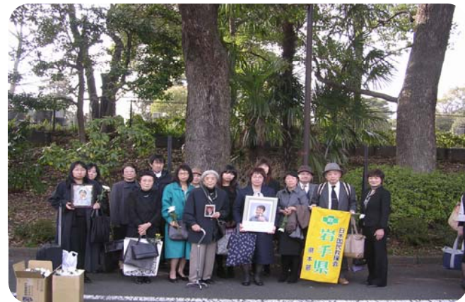
第62回解放運動無名戦士合葬追悼会 合葬に参列された、岩手のご遺族の方々