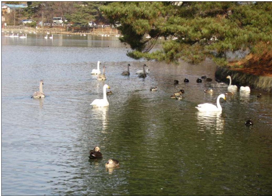
— 2007年1月 盛岡・高松の池 —

安倍政権は、昨年末の国会で国民世論を踏みにじり改悪教育基本法や「防衛省」法などをごり押しし決めてしまいました。憲法の諸原則に背くこれらの暴挙に断固立ち向かわなければなりません。人権と民主主義を守る砦としての私たち国民救援会の役割は益々重要になっていきます。北陵クリニック事件の最高裁へのとりくみなど、すべてのえん罪事件の裁判に勝利するため、ともにがんばりましょう！ 二〇〇七年 一月